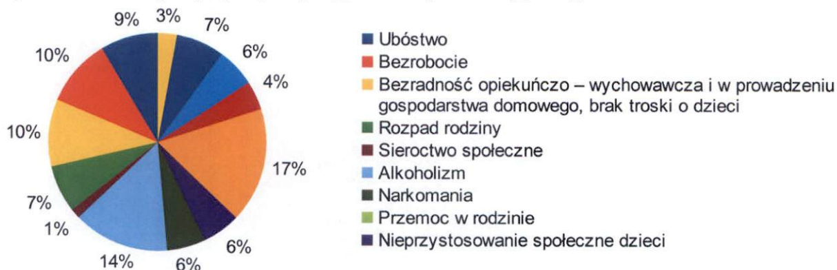
Wykres 1. Problemy najczęściej dotykające rodziny mieszkające w gminie

Dane z badań ankietowych przeprowadzonych w środowisku lokalnym.